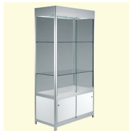
Standvitrine € 316,10 Griante 100 standing showcase 100 x 51 x 200 cm weiß/white (0014)