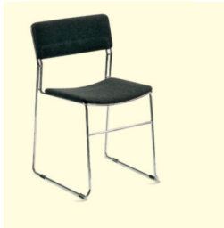
Stuhl/Chair Asti (0028) € 24,00