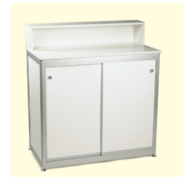
Infotheke € 174,90 Bari mit Aufsatz Info counter with build up 103 x 53 x 114 cm weiß/white (0053)