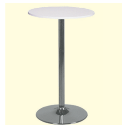
Stehtisch/Table € 58,30 Amato Ø 60 cm, Platte weiß, schwarz oder buche/Table top white, black or beech (0295)