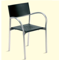
Stuhl/Chair Breeze (0029) € 30,20