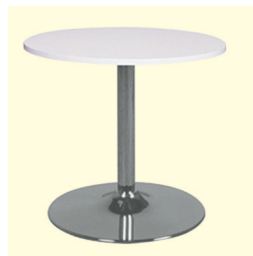
Tisch/Table € 50,60 Amato Ø 70 cm, Platte weiß, schwarz oder buche/Table top white, black or beech (0294)