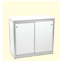
Infotheke € 150,40 Bari Info counter 103 x 53 x 94 cm weiß/white (0021)