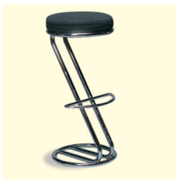
Barhocker € 27,60 Patti Bar stool schwarz/black (0022)