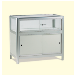
Tischvitrine € 190,30 Etna Table showcase 99 x 53 x 91 cm weiß/white (0015)