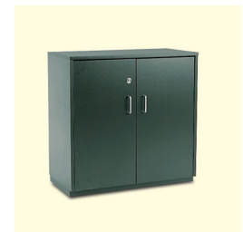
Sideboard € 97,20 Bellano weiß/schwarz/grau/ Sideboard white/black/grey (0048)