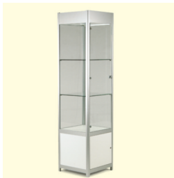
Standvitrine € 250,60 Griante 50 standing showcase 51 x 51 x 200 cm weiß/white (0052)