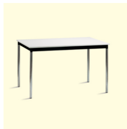
Tisch/Table € 53,20 Merida 120 x 70 cm, weiß/ schwarz/white/black (0024)